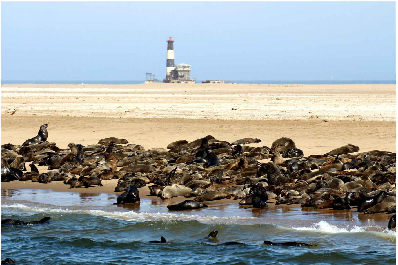
Lunch mit Austern in der Lagune

Nach dem Frühstück fahren wir vorbei an der Mondlandschaft, ein über Millionen von Jahren entstandenes Gebiet am Swakop-Flusstal, nach Swakopmund an der Küste. Unterwegs bewundern wir eine der ältesten Pflanzen der Welt, die Welwitschia Mirabilis. In Swakopmund sehen wir noch viele Bauten aus der deutschen Kolonialzeit. Es wird noch immer viel Deutsch gesprochen. Unsere Unterkunft liegt unweit des atlantischen Ozeans. 395 km (F)