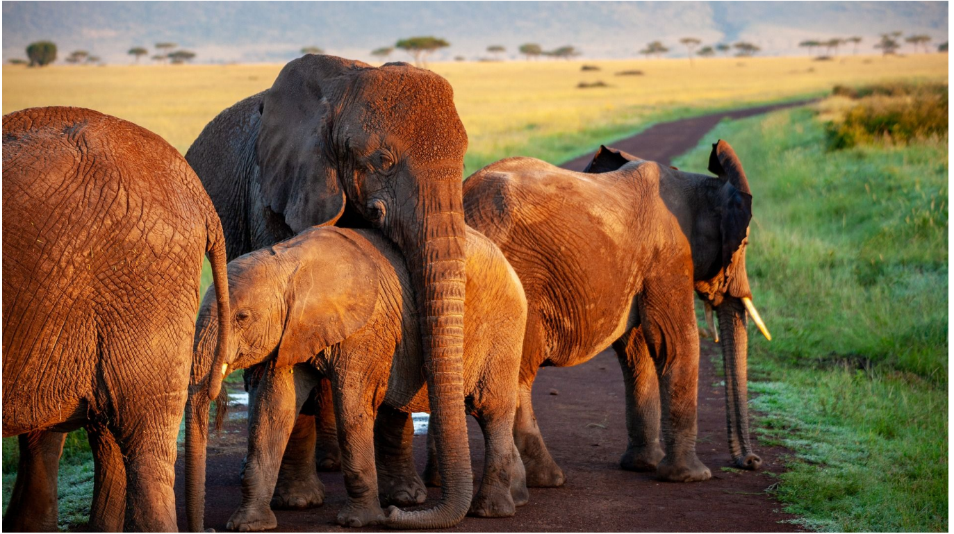
Elefantenfamilie, Nashörner, Löwen und Antilopen

Am frühen Morgen fahren wir optional nach Walvis Bay und steigen auf das bereits auf uns wartende Boot um. Während der dreistündigen Fahrt in der Lagune werden mit hoher Wahrscheinlichkeit Delfine und Robben das Boot begleiten. Gegen Mittag steuert unser Kapitän ein schönes Plätzchen in der Lagune an und zum Lunch werden neben Snacks auch frische Austern und Sekt serviert. Der restliche Nachmittag steht Ihnen anschließend zur freien Verfügung. Wie wäre es z.B. mit Quadbiken in den Sanddünen oder doch lieber ein entspannter Strandspaziergang? 100 km (F)