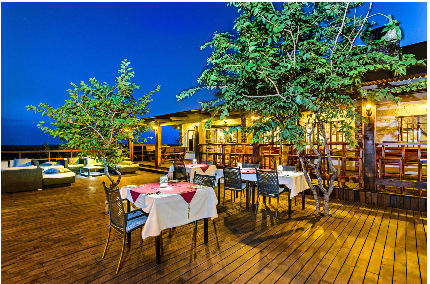
Übernachtungen in charmanten, kleinen afrikanischen Lodges

5. Tag: Namib-Wüste: Dünenmeer Sossusvlei