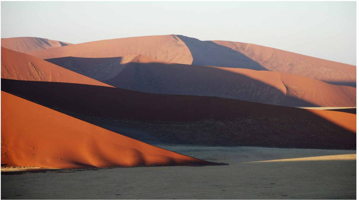
Imposante Dünenlandschaft Namib-Wüste

5. Tag: Namib-Wüste: Dünenmeer Sossusvlei