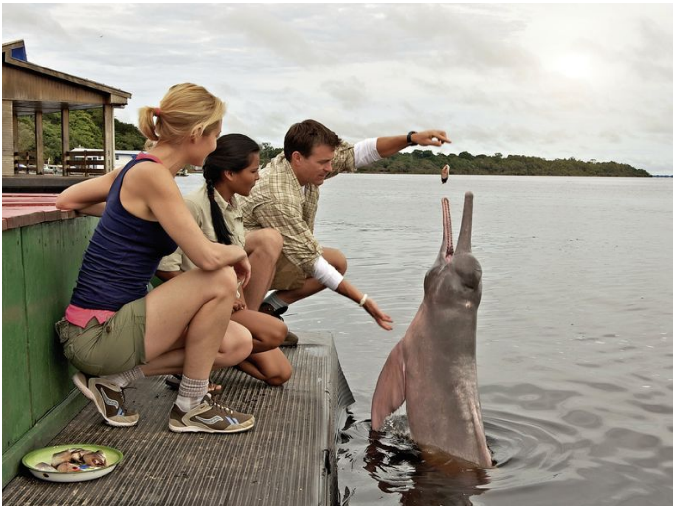
Bootsfahrt durch das Anavilhanas Flussarchipel.

Bereits am frühen Morgen unternehmen wir einen Dschungel-Spaziergang und lauschen Vorträgen über die bunte Welt des Amazonas. Nach dem Mittagessen geht es auf Fotosafari bei einer Bootsfahrt durch das Anavilhanas Flussarchipel. Rückkehr zum Schiff und Abendessen mit angenehmer Abendunterhaltung. Später steht noch ein nächtlicher Bootsausflug zur Aligatoren-Beobachtung auf dem Programm.