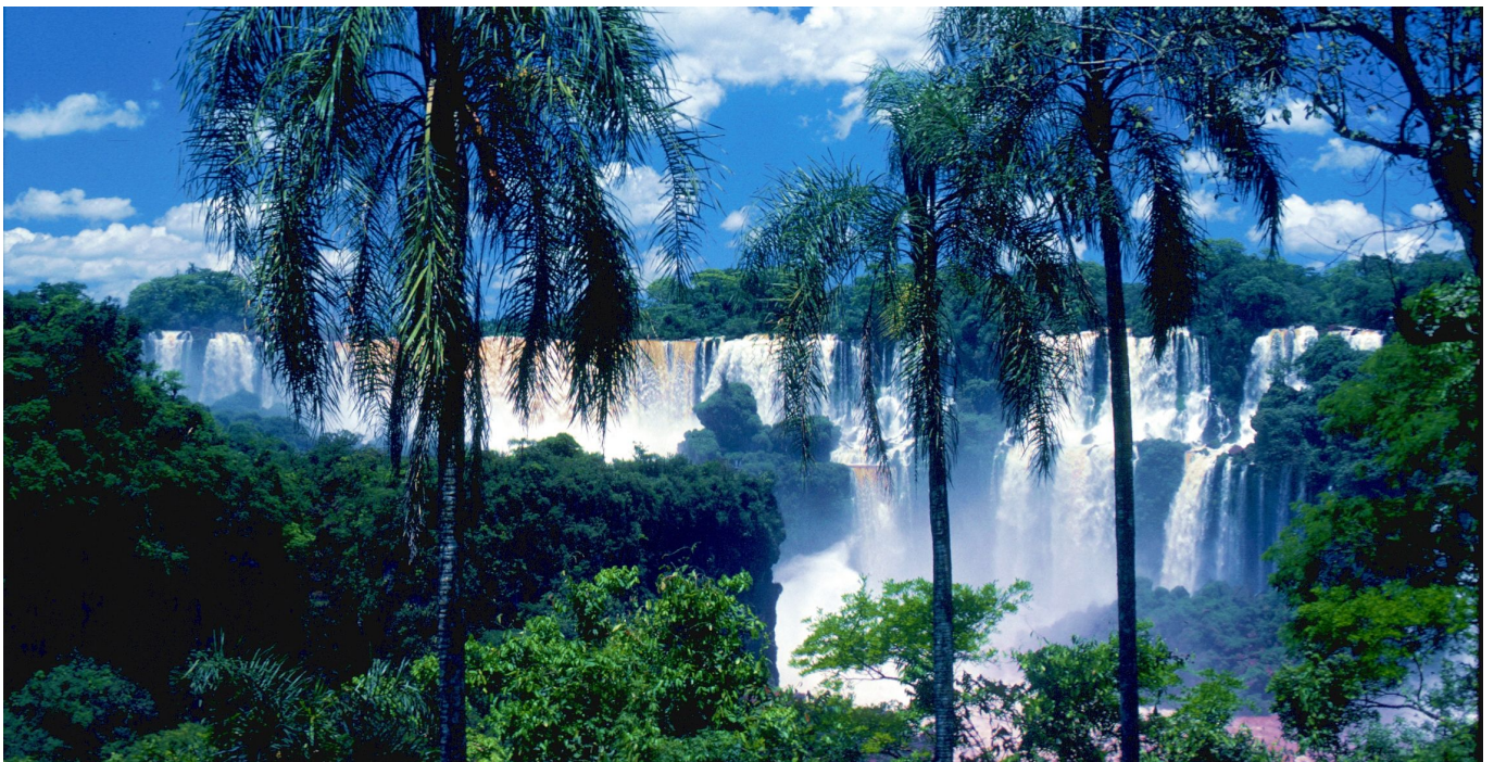
„Garganto del Diablo“ (Teufelsschlund)

„Am Morgen wechseln wir die Perspektive: beim Besuch der argentinischen Seite der Wasserfälle können wir auf Stegen den Wasserfällen ganz nah kommen. Es erwartet uns der imposante „Garganto del Diablo“