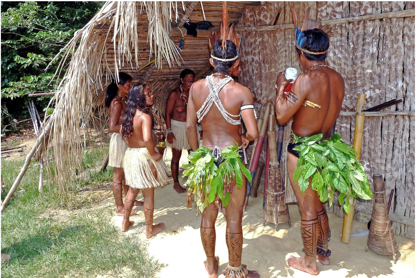
Besuch der Einheimischen im Fischerdorf Río Cuieiras

Wir besuchen in Kleinboten ein Dorf der Einheimischen am Río Cuieiras und lauschen dem Vortrag über die Fischwelt des Amazonas, Nach dem Mittagessen an Bord geht es ans Piranhafischen oder alternativ Besuch einer Farm von Einheimischen.