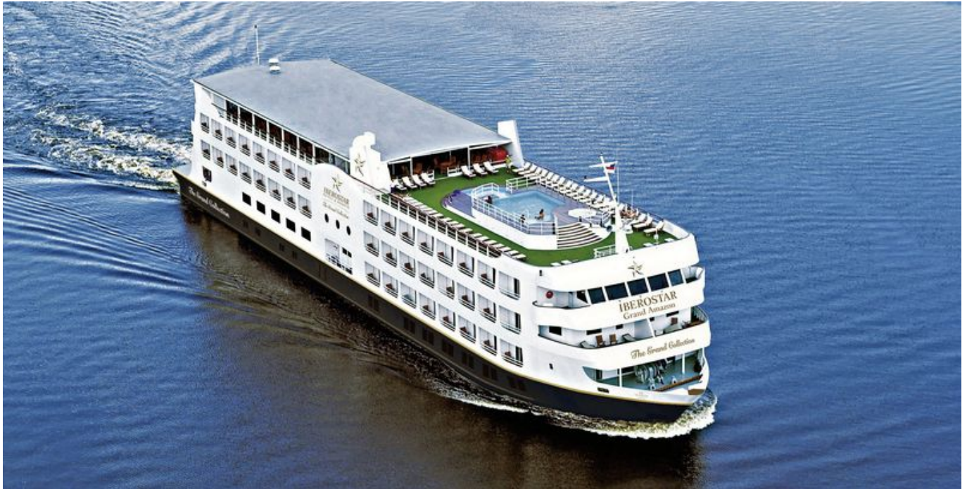
4**** Iberostar Gran Amazon

Nach dem Frühstück werden wir zum Pier gebracht. Anschließend erfolgt die Einschiffung auf die Iberostar Grand Amazon. Nach unserer Abfahrt am Abend genießen wir einen Willkommens-Drink mit dem Kapitän und die Vorstellung der Crew und anschließend unser Abendessen mit stilvoller Abendunterhaltung.