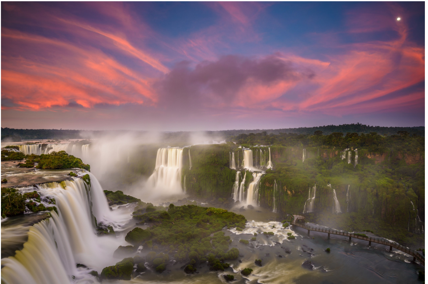
Einmalig, die Iguassu Wasserfälle